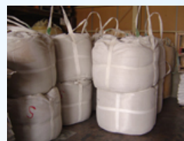
プレミックス(フレコンパック)