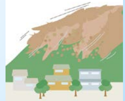
のり面の吹き付け補強